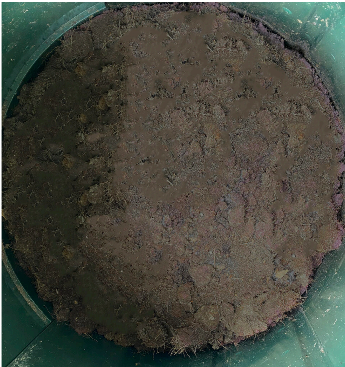
Moldvirki (jordfabrik) í lítlum kompostkassum: