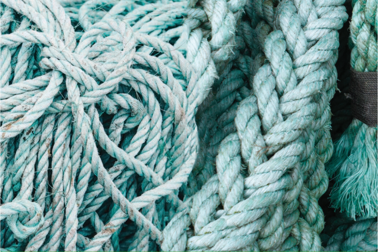
Neilonendar- og trossar