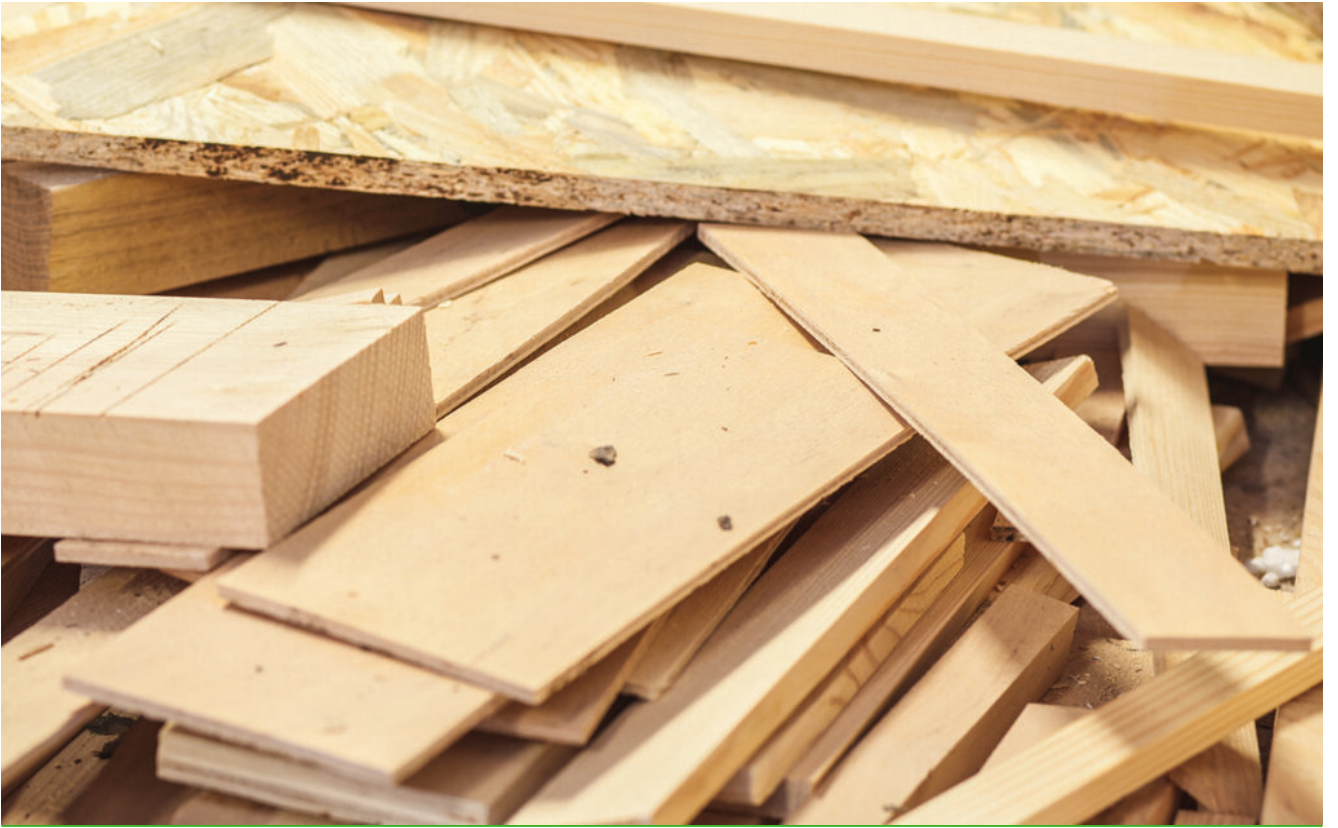
Stórt burturkast at brenna