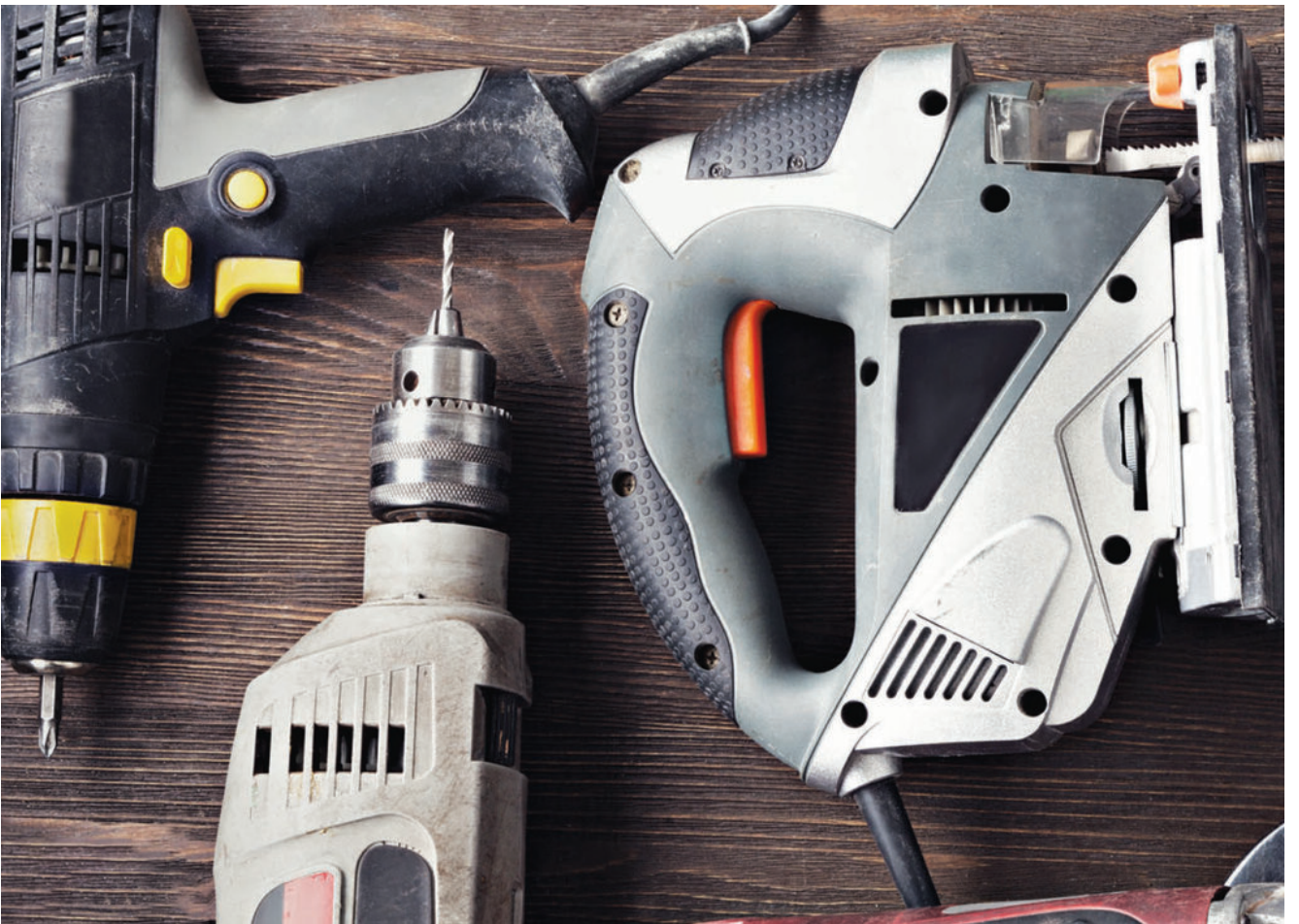
Amboð og el-tól