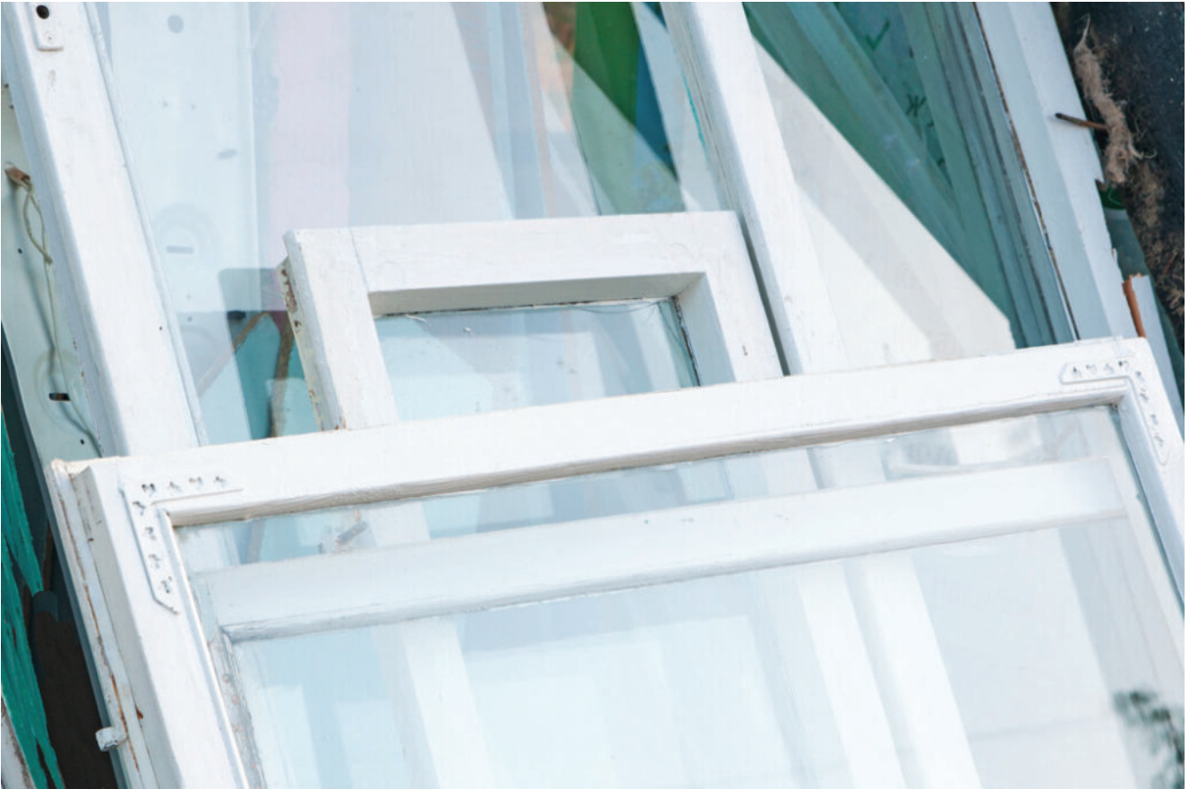
Glashurðar og -vindeygu