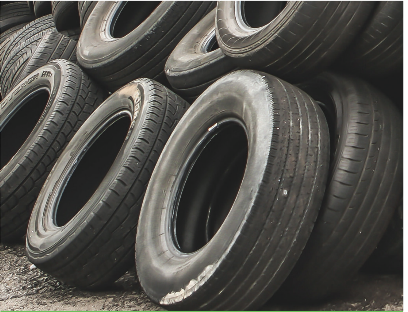
Dekk utan felgur