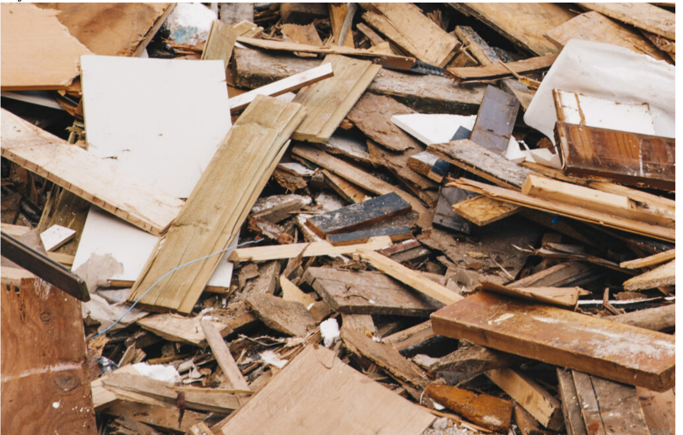
Smátt burturkast at brenna